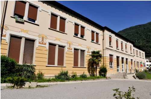
Viale G. Garibaldi, 2

Il fabbricato soddisfa le norme di igiene e sicurezza e ha regolare certificazione di prevenzione incendi.